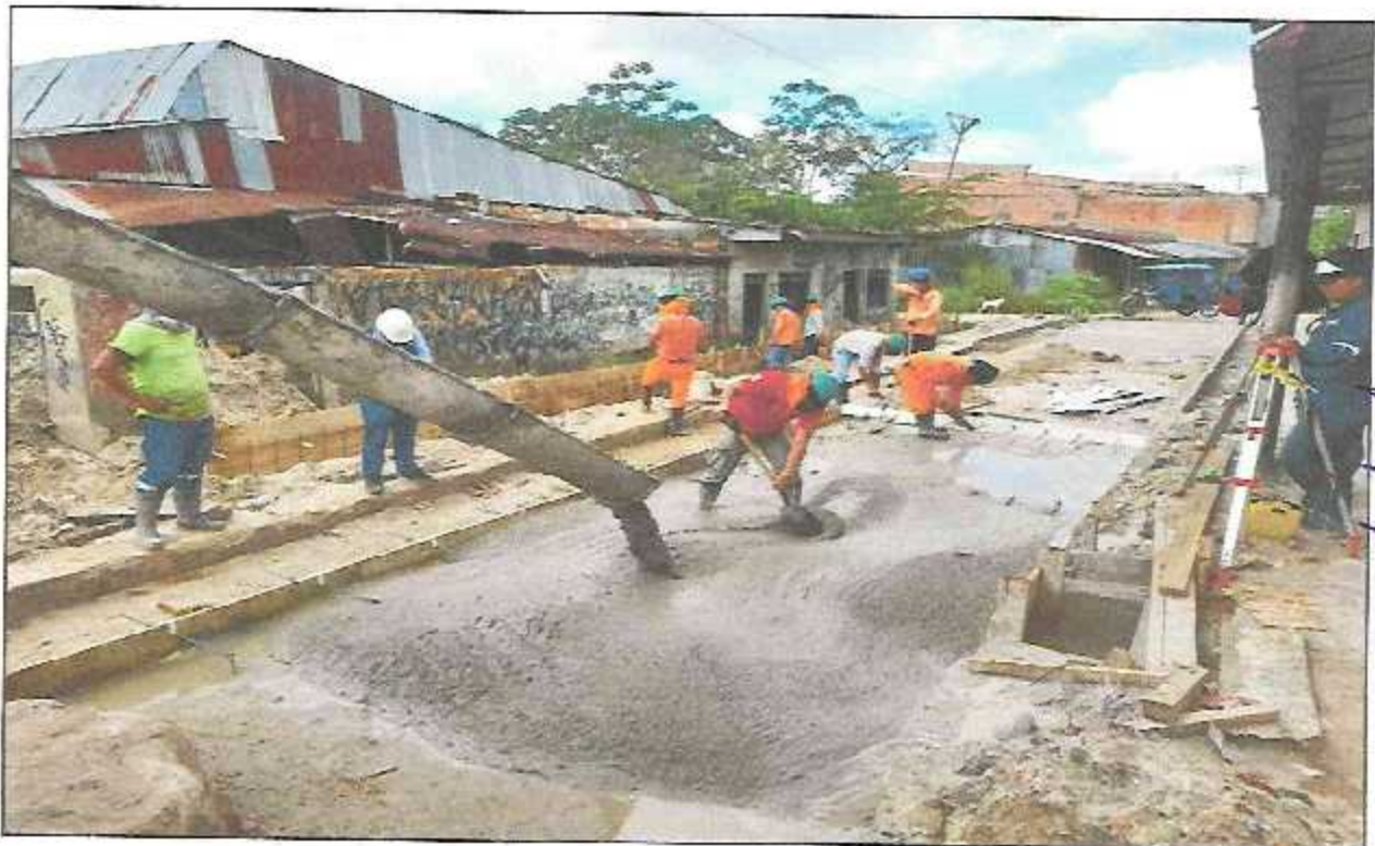
VISTA FOTOGRÁFICA N° 06: VACEADO DE LOSA DE RODADURA EN CALLE JUNÍN TRAMO III.