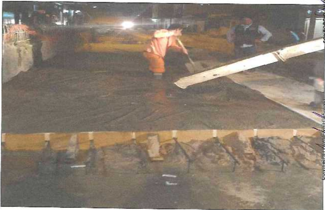
VISTA FOTOGRÁFICA N° 10: VACEADO DE LOSA DE RODADURA EN CALLE SALAVERRY.

CONSORCIO PAVIMENTO CASTAÑAL ING SILVIA ZORADA CHUQUIBAL-QUISPE INGENIERA DE OBRA R.N. N° 44673