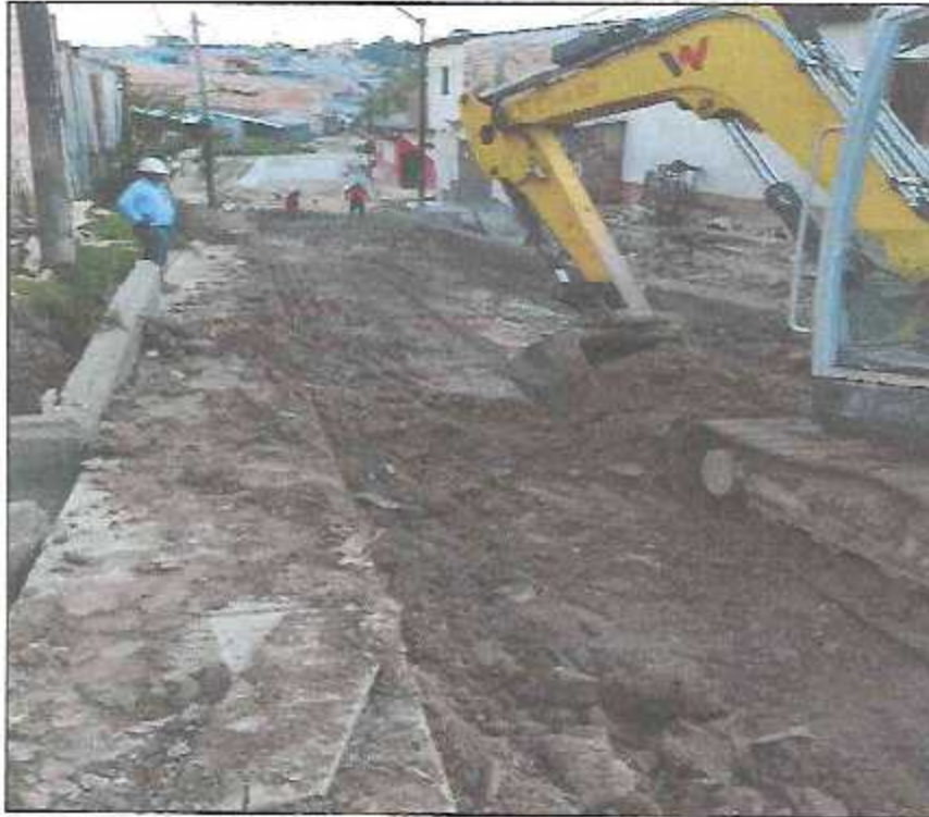
VISTA FOTOGRÁFICA N° 01 : CORTE DE TERRENO A NIVEL DE SUB RASANTE EN CALLE JUNÍN TRAMO II.