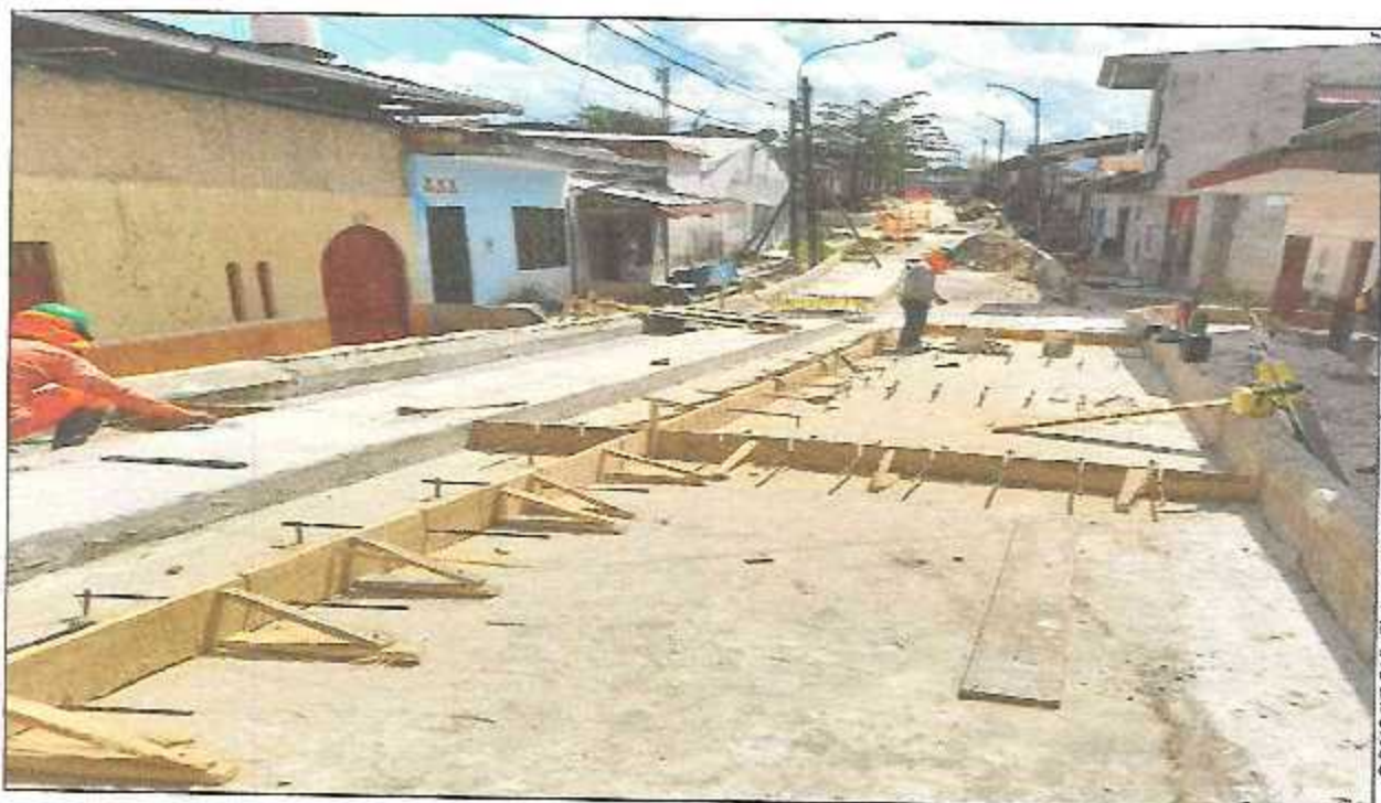
VISTA FOTOGRÁFICA N° 14: COLOCACIÓN DE PASADORES DE FIERRO LISO Ø 5/8" EN JUNTAS DE DILATACIÓN Y CONTRACCIÓN, Y PASADORES DE FIERRO CORRUGADO Ø 1/2" EN JUNTAS DE ARTICULACIÓN LONGITUDINAL EN PASAJE IMPERIO.

Pedro Miguel García-Villera Jefe Supervisor CIP N° 62097