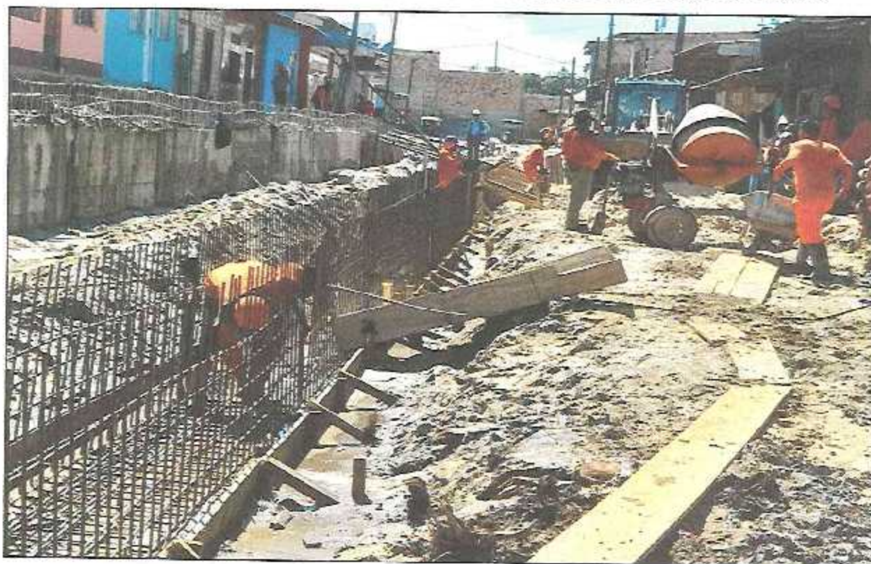
VISTA FOTOGRÁFICA N° 12: ACERO CORRUGADO Ø 1/2" EN CANAL RECTANGULAR EN CALLE SALAVERRY.

CONSORCIO PAVIMENTO CASTAÑAL ING SILVIA ZARZA CAJALIGUITAL OUSPE REPRESENTANTE DE OBRA RP N° 44878