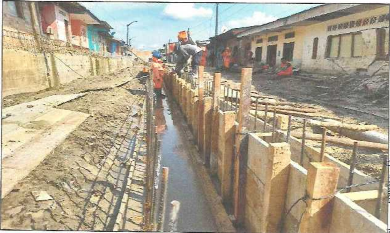
VISTA FOTOGRÁFICA N° 13: ENCOFRADO EN MUROS LATERALES DE CANAL RECTANGULAR EN CALLE SALAVERRY.