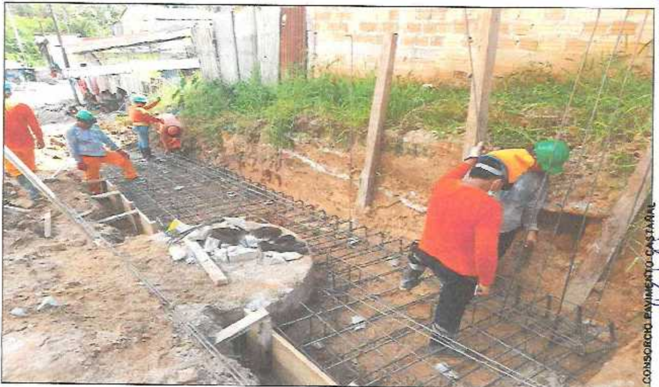
VISTA FOTOGRÁFICA N° 16: ACERO CORRUGADO \varnothing 1/2" , f_y = 4200 \text{ Kg/cm}^2 EN MURO DE CONTENCIÓN TIPO I.

CONSORCIO PAVIMENTOS CASTAÑAL Manuel Wilfredo Heredia Magaña Representante Común