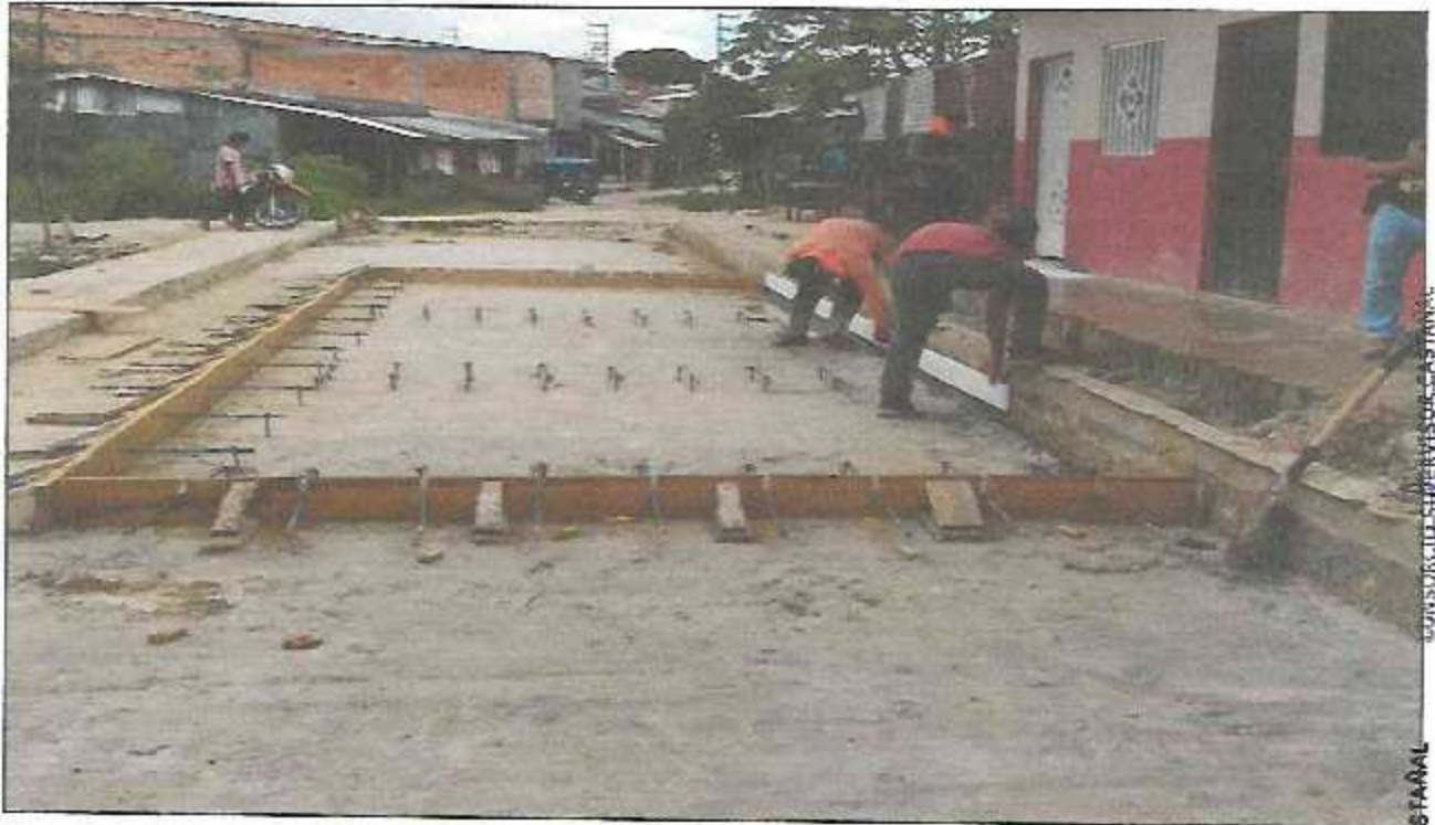
VISTA FOTOGRÁFICA N° 09: ENCOFRADO EN LOSA DE RODADURA EN CALLE JUNÍN TRAMO III.