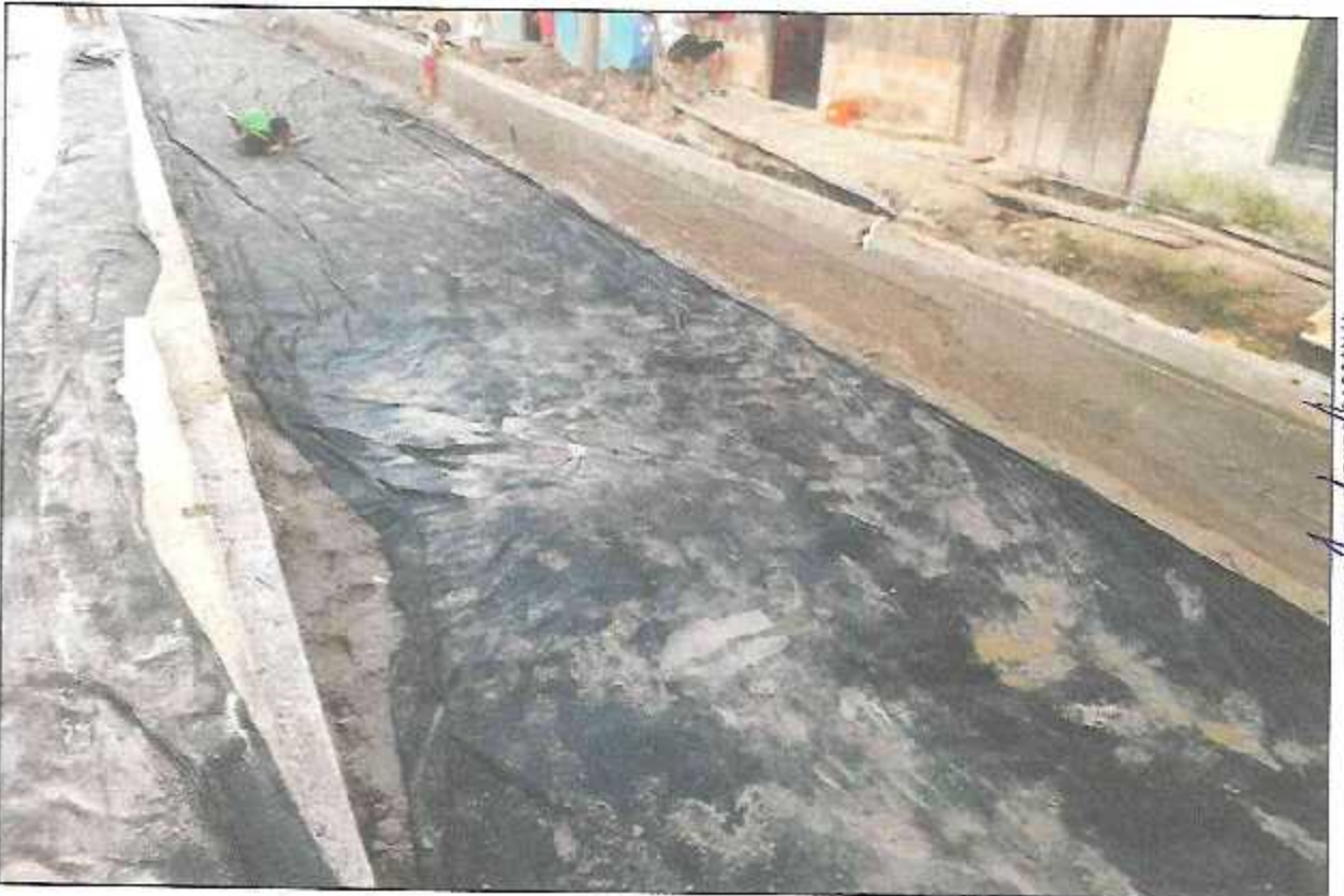
VISTA FOTOGRÁFICA N° 04:

ING SILVIA ZORRILLA CHUQUITAL OUISPE RESIDENTE DE OBRA